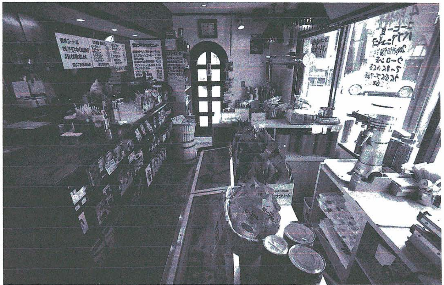
▲喫茶コーナーから入口方向を見る。右手が豆売りコーナーで、左手が喫茶の厨房と提供カウンター。喫茶はセルフサービスだが、コーヒーはオーダーごとにハンドドリップ。カレーはPBを目指す手づくり商品