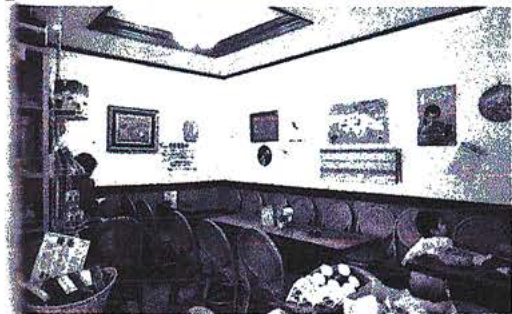
▲11坪の店舗面積のうち半分弱が喫茶スペースで、席。日商10万円のうちイトインで3万円を売る ▶2つの大きな住宅地区に挟まれた場所の中間地域の角地に1月30日出店