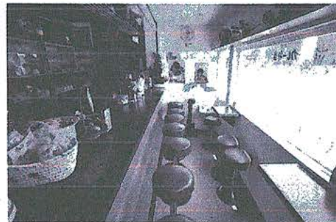
▲プチカフェー白井店の店内。わずか1、2坪のスペース。従業員はオーダー、提供時のみ本店奥から出てくる。酒販店などへの併設スタイルとして考案した