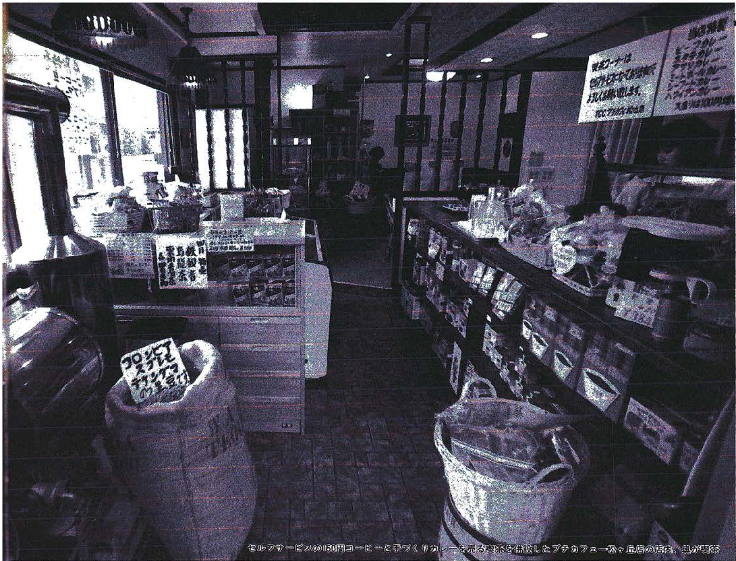
セルフサービスの150円コーヒーと手づくりカレーを売る喫茶を併設したプチカフェ松ヶ丘店の店内。奥が喫茶